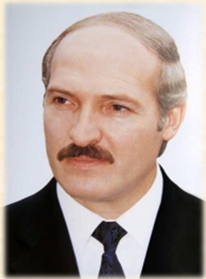
ЛУКАШЕНКО АЛЕКСАНДР ГРИГОРЬЕВИЧ

Родился 30 августа 1954 года в г.п. Копысь Оршанского района Витебской области.